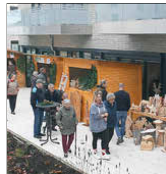
Am 10. und 11. November 2023 bummelten mehr als 400 Gäste über den St.-Martins-Markt der Volkssolidarität am und im CampHus Ludwigslust

ben Ort für das kommende Jahr geplant wird.