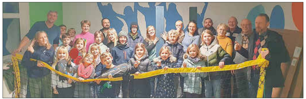
Übergabe der neuen Spielgeräte