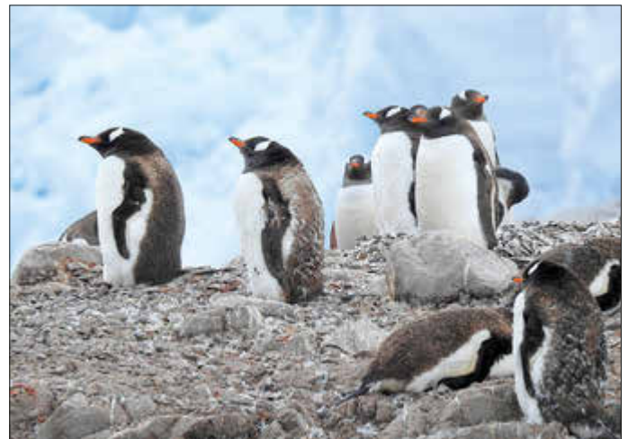
Eselspinguine auf dem Neko Harbor Festland