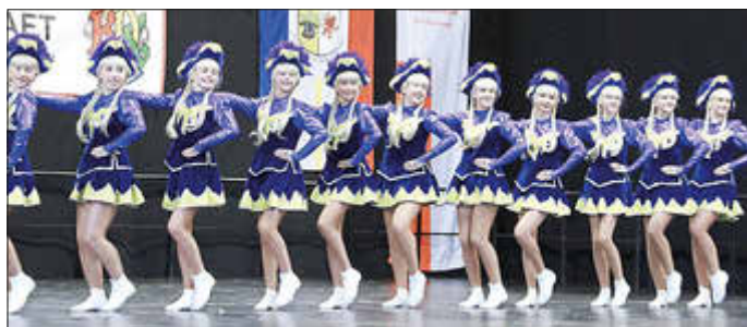
die „kleinen Funken“

Frohe Weihnachten und einen guten Rutsch ins neue Jahr wünscht Ihr