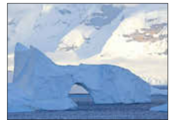
Danco Island Küste

Lassen sie sich auf diese Reise von Dr. Klaus-Dieter Feige mitnehmen. Eindrucksvolle Bilder werden durch interessante Fakten bereichert. Die Antarktis vergisst man nie wieder. Der Unkostenbeitrag beträgt für Mitglieder der NGM 3 Euro, für Gäste 4 Euro.