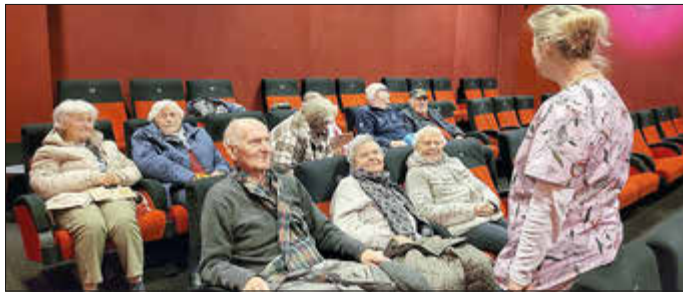
Die Gäste der Tagespflege Ludwigslust waren schon vor dem Beginn des Films voller Vorfreude

Die Tagespflege Ludwigslust ist neben der Tagespflege CampHus eine von zwei Einrichtungen dieser Art der Volkssolidarität SWM in Ludwigslust. Am Forstthof werden bis zu 21 Tagesgäste von Montag bis Freitag tagsüber betreut. Tagespflege Ludwigslust, Telefon: 0 38 74 - 570 32 23; E-Mail: tagespflege-ludwigslust@vs-swm.de