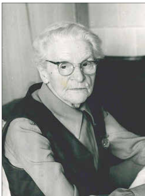
Die erste Bürgermeisterin von Ludwigslust - Meta Malikowski