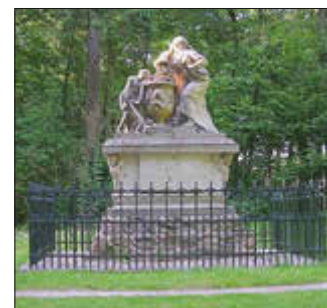
Das Denkmal für Friedrich den Frommen im Schloßpark

Vor 280 Jahren - am 2. März 1746 - heiratete er Louise Friederike von Württemberg, die Tochter von Erbprinz Friedrich Ludwig von Würt-