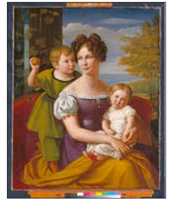
Wilhelm von Schadow: Erbgroßherzogin Alexandrine von Mecklenburg-Schwerin mit ihren beiden ältesten Kindern, um 1825 (SSGK M-V)

geschichte des preußischen Hofes im 19. Jahrhundert. Sein letztes Buch ist den „Preußischen Prinzessinnen“ aus der Epoche der Romantik gewidmet, zu denen auch Alexandrine von Preußen gehört. Der Eintritt kostet 5,00€, Tickets gibt es an der Abendkasse. Einlass ist ab 17:30 Uhr. Es ist eine Kooperationsveranstaltung zwischen der SSGK MV und dem Förderverein Schloss Ludwigslust e. V.