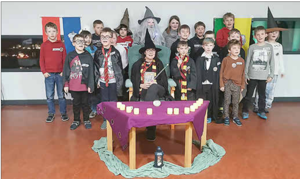
Kinder der Kita Alt Krenzlin bei der Harry Potter Lesenacht

Gemeinsam begaben sich alle auf die spannende Suche nach dem „Geheimnis des Steins der Weisen“ und erlebten eine unvergessliche Nacht voller Fantasie und Abenteuer.