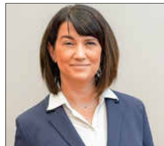
Jacqueline Bernhardt, Ministerin für Justiz, Gleichstellung und Verbraucherschutz in MV

Der Eintritt ist frei. Um Anmeldung wird gebeten unter campus@vs-swm.de oder unter 03874 6699030.