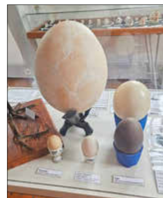
Ei des Madagaskar-Riesenstraußes, zusammen mit Eiern von Strauß, Emu und Haushuhn

Highlight ist das riesige Ei des ausgestorbenen Madagaskar-Riesenstrauß', der nicht umsonst auch Elefantenvogel genannt wird. Sein Ei ist sechsmal größer als das eines gewöhnlichen Straußes und damit das größte Vogelei der Welt! Aber auch die Eigelege vieler anderer Tiere können bestaunt werden, unter anderem ein 120 Mio. Jahre altes Dinosaurier-Ei des Hadrosaurus . Nur noch in diesem Jahr wird die weltweit einzige in 3D-Form erhaltene Versteinerung einer Hai-Eikapsel zu sehen sein. Obendrein locken eiszeitliche „Steineier“ und nicht zuletzt eine Sammlung von über 200 zum Teil historischen Eierbechern Osterausflügler ins Natureum. Darüber hinaus hat das Natureum auch dieses Osterwochenende wieder interessante Gäste mit dabei. An Karfreitag und Ostersonntag stellt Herr André Kühling (Perleberg) mit seiner Familie als Mitglied des Rassekaninchenzuchtverein M5 Grabow die Kaninchenrassen Blaue und Graue Wiener, Gelb-Rexe und deutsche Riesen in Grau vor. Am Ostersonntag und Ostermontag gibt es gefiederte Unterstützung von richtigen Jägern der Lüfte: der Falkner