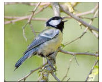
Die Kohlmeise ist ein typischer Bewohner von Parks und Gärten.

mit 140 nachgewiesenen Arten sehr artenreich. Alle Interessierten sind herzlich zur Exkursion am Dienstag, den 14.04.2026 eingeladen. Sie beginnt um 18:00 Uhr und wird bis circa 19:45 Uhr dauern. Treffpunkt ist das Natureum neben dem Schloss. Der Unkostenbeitrag beläuft sich für Mitglieder der NGM auf 3 € und für Gäste auf 4 €.