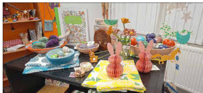
Ostern steht vor der Tür

Schauen Sie doch mal herein und lassen sich von dem reichhaltigen Sortiment an Kaffee, Tee und Schokolade oder dem bunten Frühlingsangebot überraschen.