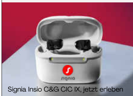
Signia Insignia C&G CIC IX, jetzt erleben