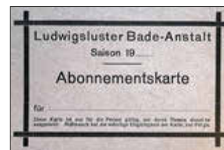
Eintrittskarte für die Flussbadeanstalt, Stadtarchiv

Sind diese drei Damen eventuell heute noch Ludwigslustern bekannt? Für Hinweise und Erinnerungen wären wir sehr dankbar. Sie erreichen Bernd Wollschläger telefonisch unter 0173/2474039