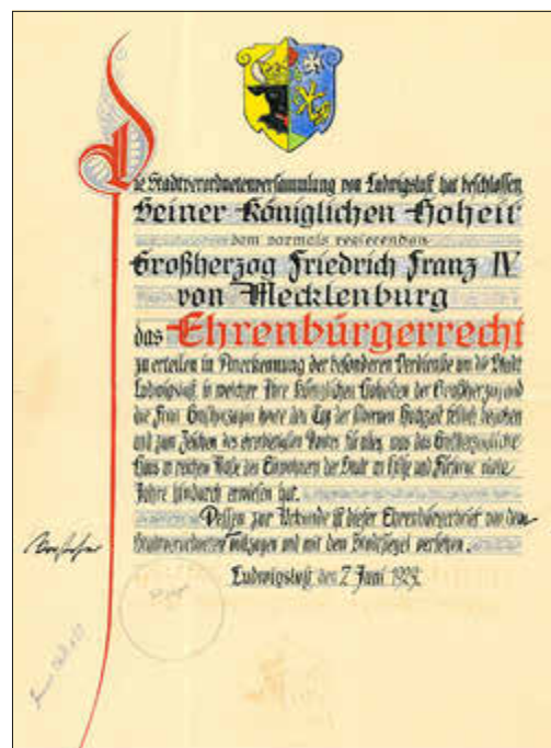
Der Entwurf für die Ehrenbürgerurkunde für Großherzog Friedrich Franz IV aus dem Jahr 1929