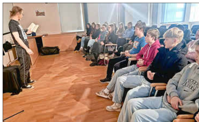
9. Klassen des Goethe-Gymnasiums Ludwigslust

Schüler ein Roadmovie, bewegend, unterhaltsam und äußerst witzig! In dem preisgekrönten Jugendbuch „Tschick“ von Wolfgang Herrndorf geht es um den 14-jährigen Maik, der völlig frustriert ist- seine Angebotete will nichts von ihm wissen, die Selbstzweifel münden in Langeweile. Da kommt Tschick daher, ein Russlanddeutscher aus seiner Klasse, der ihn auf eine Reise Richtung Walachei entführt - in einem eigens dafür „geliehenen“ Lada. Diese Lesungen waren für Schüler wie Lehrer ein Erlebnis unter dem Thema „Flucht aus der Sucht“.