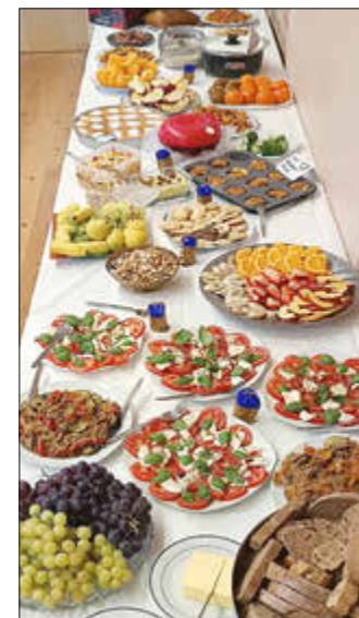
Buntes Buffet und festlicher Tischschmuck

Das Café International (ehem. Café der Vielfalt) hat am 27.03. eine großartige Auftaktveranstaltung gefeiert. Im Mittelpunkt stand das iranische Neujahrsfest Nowruz, welches zum Frühlingsbeginn gefeiert wird. Mitvorbereitet wurde es von Teilnehmerinnen des MIA-Kurses, die ebenso wie viele der zahlreichen weiteren Gäste leckere Speisen zum bunten Buffet beisteuerten. Sie gestalteten außerdem den traditionellen Tischschmuck für Nowruz, der aus sieben Zutaten besteht, deren Namen alle mit dem persischen Buchstaben „س“ (S) beginnen und die Wünsche für das neue Jahr symbolisieren. Mit Musik, Tanz, Spielen und vielen interessanten Gesprächen zwischen den Gästen aus verschiedensten Ländern und Kulturen klang das erste Café International nach mehreren Stunden aus. Das