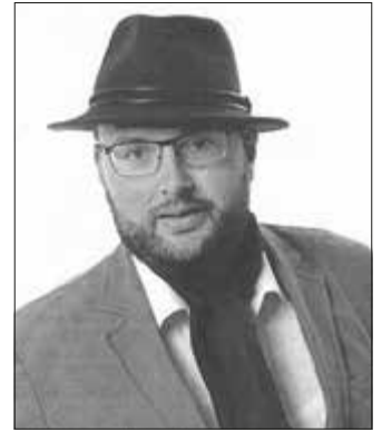
Der Boizenburger vertellt allerhand Snaaksches

der Autor bewiesen, dass er nicht nur mit humorvollen Texten und kritischem Sachverstand auf unterhaltsame Weise das Publikum begeistern kann, sondern auch ein angenehmer Gesprächspartner nach der Lesung ist. Gäste sind herzlich willkommen. Der Eintritt kostet 5,- € an der Ta-geskasse. Eine vorherige Reservierung ist nicht notwendig.