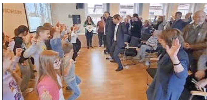
Bei der Jahrestagung der Gesellschaften animierten die Schüler der Fritz-Reuter-Schule die Gäste auf Platt zum Yoga.

sonst eine Rolle. Immerhin trägt sie den Namen des plattdeutschen Heimatdichters. Gerade hat sie vom Bildungsministerium MV das Siegel „Hier ward Plattdüütsch snackt! Anerkannte Bildungseinrichtung zur Pflege der niederdeutschen Sprache“ erhalten. Neben plattdeutschen Gedichten und Liedern hatten die Drittklässler auch Yoga auf Platt einstudiert. Bei Figuren wie „De Strandkorf“ und „De stife Bries“ machte das Publikum noch begeistert mit. Doch dann kam die letzte Übung: „De Flunner“ – und die Schüler legten sich platt wie eine Flunder auf den Boden. Da stiegen die Gäste dann doch lieber aus und quitierten das mit einem Lachen. Beim Lied „Dat du min Leevsten büst“ waren dann aber alle wieder dabei. Als sehr erfrischend sei das