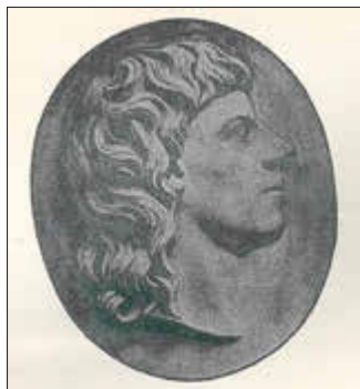
Selbstbildnis Kaplungers

Am 2. April 1746 wurde Rudolph Kaplunger im böhmischen Bechin (heute Bechyně in Tschechien) als Sohn eines Bildhauers geboren. Bereits in jungen Jahren unterrichtete sein Vater ihn im Zeichnen und erkannte sein künstlerisches Talent. Kaplungers Vater förderte ihn auch während seiner Ausbildung zum Bildhauer. Während dieser Zeit ging Rudolph Kaplunger auf ausgedehnte Studienreisen u.a. nach Prag, Paris, Dresden und Wien, auf denen er seine Fertigkeiten vertiefen konnte.