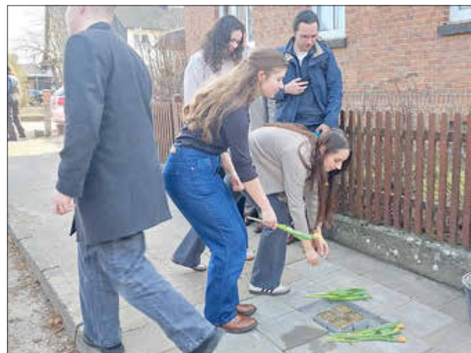
Schüler legen Blumen nieder.