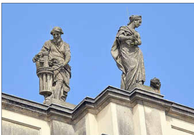
Diese Attikafiguren symbolisieren die Mechanik und die Architektur