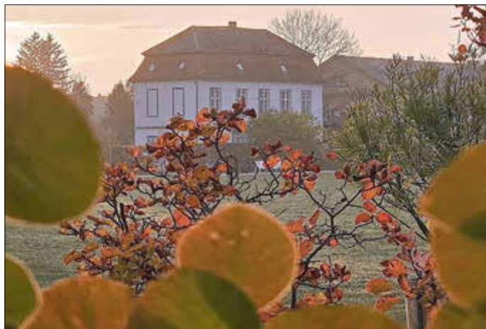
Das Natureum der NGM