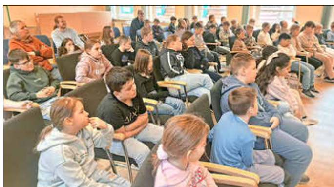
Kinder hören gespannt aus ihren „Superbüchern“