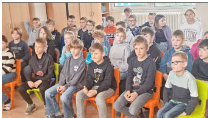
Auch in der Grundschule Kummer freuten sich die Kinder auf die gewählten „Superbücher“