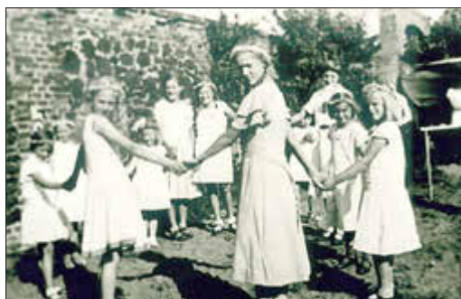
Sommerfest im Hort 1934

1934 zog das Helenen-Seminar noch in das Fliednerhaus um. Doch schon vier Jahre später wurde das Seminar geschlossen, so dass es diese eher unbekannte Ausbildungsstätte nur 12 Jahre in Ludwigslust bestand.