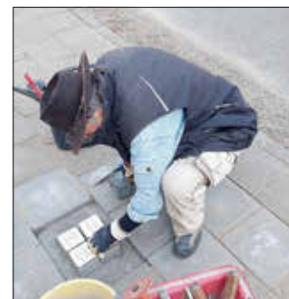
Gunter Demnig beim Einsetzen der Stolpersteine