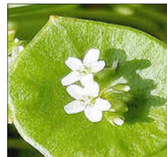
Das Tellerkraut (Claytonia palustris) ist seit ca. 10 Jahren aus dem Schlosspark bekannt. Es kommt eigentlich aus Nordamerika.