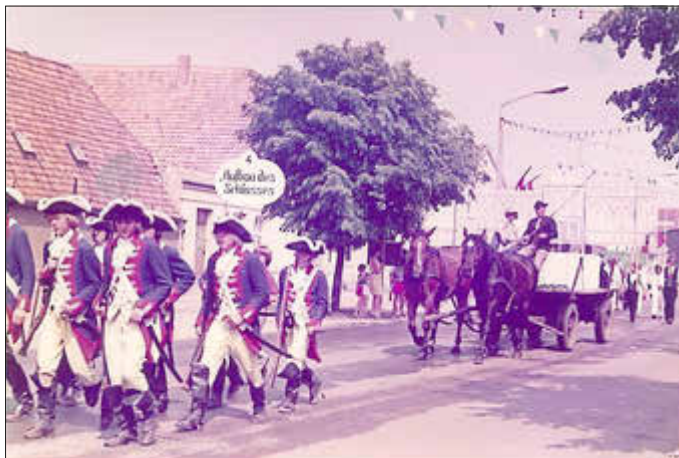
Der Aufbau des Schlosses

Die dritte Etappe widmete sich mit der Zeit nach 1952 und dem sozialistischen Aufbau, einschließlich Neubauten, die Entwicklung des Sportes und der Kultur und sozialistischer Errungenschaften. Die einzelnen Bilder wurden von zahlreichen Betrieben und Kollektiven der Stadt unterstützt.