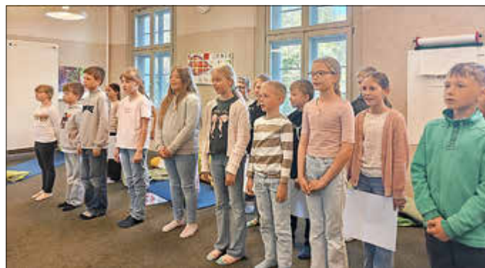
Die Drittklässler der Grundschule „Fritz Reuter“ übten für ihren Auftritt beim Landesfinale des 17. Plattdeutschwettbewerbs MV.

Text: K. Neumann, Grundschule Fritz Reuter