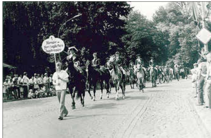
„Klenower Reiter“ - Das erste Bild des Umzugs

Am 27. Juni 1976 fand anlässlich des 100-jährigen Stadtjubiläums ein Festumzug statt. Der Umzug bewegte sich von der Klenower Straße über den Platz des Friedens, die Kanalstraße, die Seminarstraße, die Lindenstraße und die Schloßstraße, vorbei an der Ehrentribüne vor dem Rathaus, und endete in der Gartenstraße. Allen Besuchern sollte die Entwicklung der Stadt auf abwechslungsreiche und anschauliche Weise nähergebracht werden. Dazu wurde der Umzug in drei thematische Abschnitte gegliedert. Der erste Abschnitt zeigte die historischen Ursprünge der Stadt. Ausgangspunkt war das Dorf Klenow und die Lebensweise der Bauern. Darüber hinaus wurden die Entwicklung zur Resi-