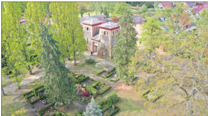
Luftbild der Glockentürme am Friedhof Ludwigslust