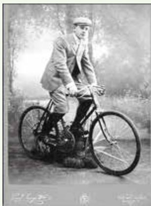
Ludwigsluster Radfahrer um 1905

Anhand historischer Fotos wird aus dem Vereinsleben berichtet, es werden historische Fahrräder gezeigt und Fahrradhändler aus Ludwigslust vorgestellt.